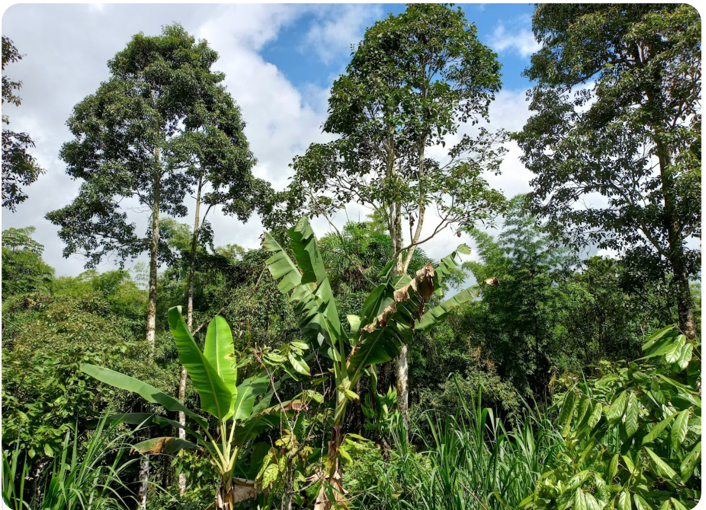
Figura 2: Sistema agroforestal diversificado en el departamento de Tolima, Colombia