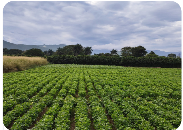
EAP Zamorano/Dr. Juan Carlos Rosas

Suelos de Honduras es una iniciativa que busca optimizar las recomendaciones agronómicas para mantener y aumentar la producción, con información de suelos basada en evidencia y cocreación de conocimiento con actores locales.