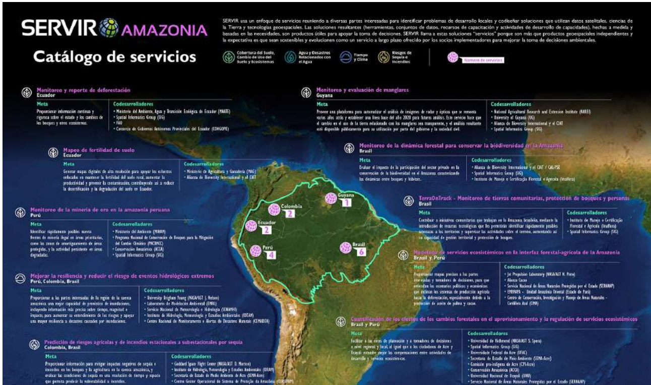
Figura 1: Catálogo de servicios SERVIR AMAZONIA.