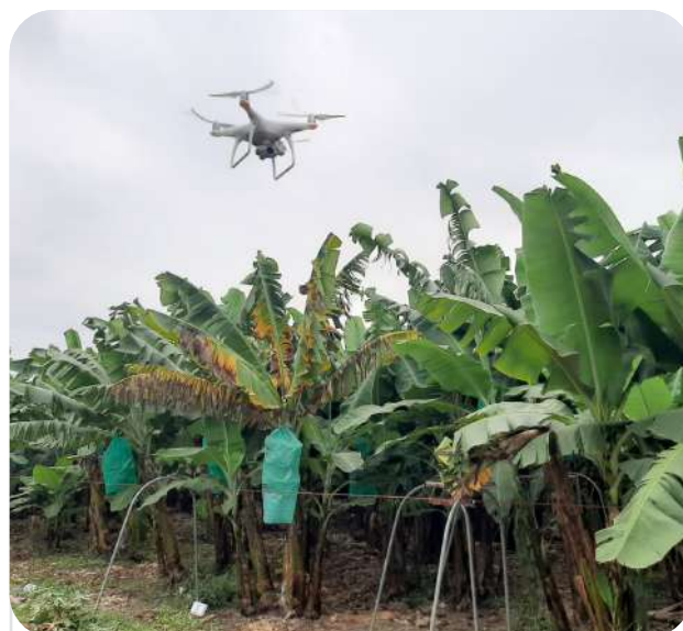
CIAT / J.E. Vargas