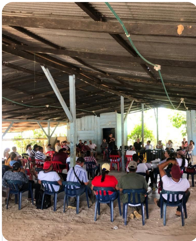
📷 Rutas PDET | CIAT/Programa de Forrajes

Hemos apoyado al gobierno colombiano en la búsqueda y construcción de la paz en el país. Junto con AGROSAVIA hemos colaborado en programas para sustitución de cultivo ilícitos (proyecto Bolsa de Semillas para la Paz). Actualmente trabajamos en iniciativas que buscan lograr la estabilidad social y económica en territorios afectados por el conflicto armado en los departamentos de Caquetá, Putumayo y Nariño ( Proyecto Rutas PDET ); así como en proyectos que buscan contribuir a reducir las emisiones de gases de efecto invernadero, conservar los bosques, restaurar paisajes y mejorar los medios de vida rurales, estimulando al mismo tiempo la consolidación de la paz en la Colombia rural ( Proyecto SLUS ).