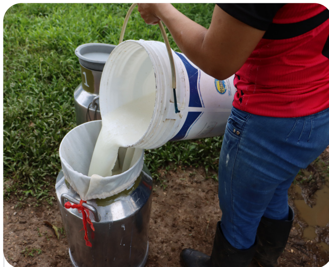
CIAT/Programa de Forrajes