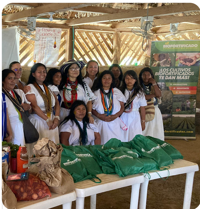
CIAT/Programa de Biofortificados

Junto con AGROSAVIA y con el apoyo de la Asociación de Productores Agroecológicos Indígenas y Campesinos de la Sierra Nevada de Santa Marta y la Serranía del Perijá (ASONEI), hemos trabajado en el fortalecimiento de un modelo agroecológico para cultivos biofortificados basado en tecnologías con enfoque étnico y de género , que ha aportado a la seguridad alimentaria de las familias Arhuacas de la comunidad Umuriwa de la Serranía del Perijá. Este modelo productivo propuesto respeta el conocimiento ancestral de las comunidades indígenas, empodera a las mujeres de la comunidad bajo un enfoque participativo y promueve el compartir de saberes en la siembra de cultivos como el frijol, el maíz y el arroz para fortalecer la autonomía alimentaria con énfasis en manejos agroecológicos. Para lograrlo, el proyecto utiliza un plan de vinculación tecnológico y la promoción de acciones dirigidas al consumidor local o regional para facilitar la comercialización de excedentes de cosecha, permitiendo que la comunidad pueda diversificar sus cultivos, para que además de los tradicionales cultivos de café y del cacao, puedan tener cultivos de ciclo corto que fortalezcan su seguridad alimentaria y nutricional.