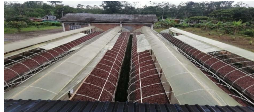
Ilustración 2. Vista de Arriba Secadero Parabólico (Ventilación)