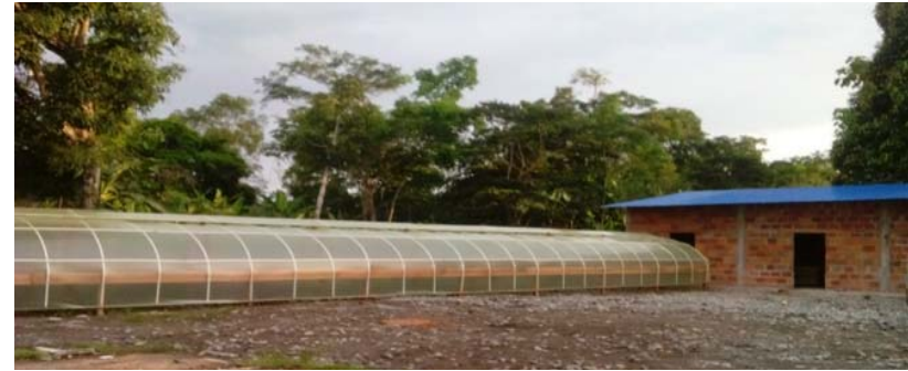
Ilustración 1. Vista Lateral Secadero Parabólico

El sistema de secado planteado permite que el control de la temperatura, humedad relativa y ventilación; se controlen parcialmente por la abertura superior en la cubierta; y subiendo y bajando las cortinas laterales; las cuales también tienen como funcionalidad proteger el grano de las condiciones ambientales.